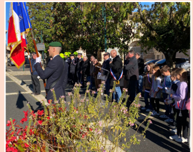
▲ Cérémonie du 11 novembre ▼