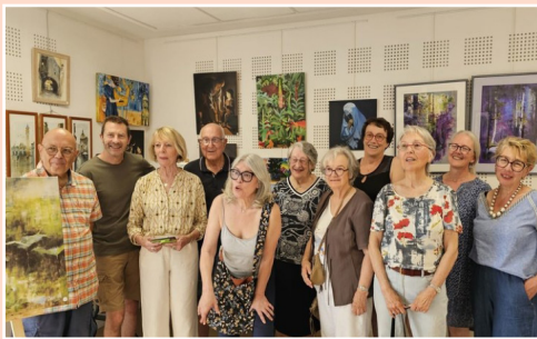
▲ Exposition de Cahuz'arts ▼