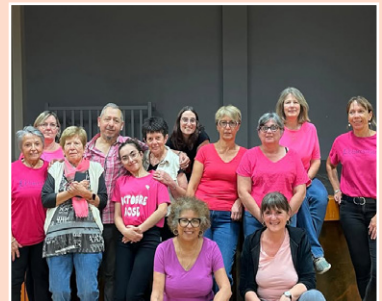
▲ Octobre Rose de 1001 Danses ▼