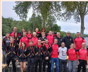
▲ Trail des Vendanges 2025 de l'amicale des Sapeurs-Pompiers de Cahuzac sur Vère ▼