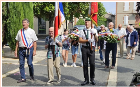
▲ Cérémonie du 14 juillet ▼