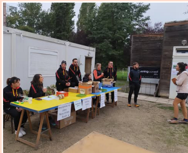
▲ Randonnée du cœur de la Grande Vadrouille ▼