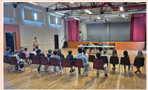
▲ Election du CME 2025-2027 ▼