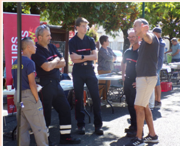
▲ Forum des associations 2025 ▼